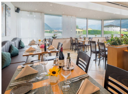
Una cena esclusiva nel nostro ristorante