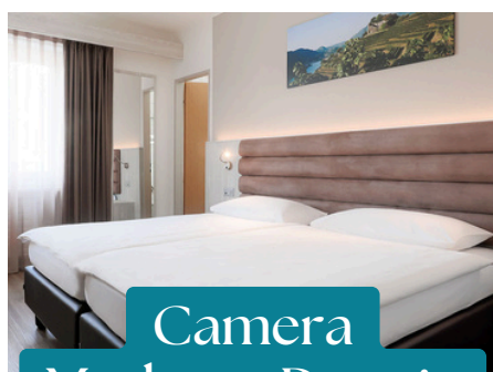
Camera Moderna Doppia CHF 684.-

da venerdì 18 aprile a lunedì 21 aprile 2025