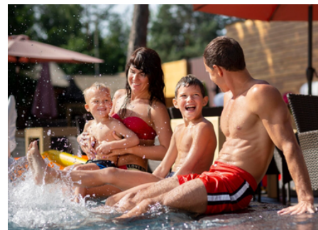
Entrata allo Splash & Spa Tamaro