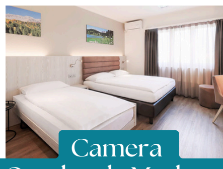
Camera Quadrupla Moderna CHF 918.-