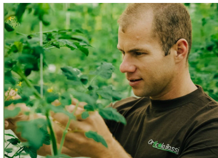
Visita all'Orticola Bassi Scopri le curiosità!